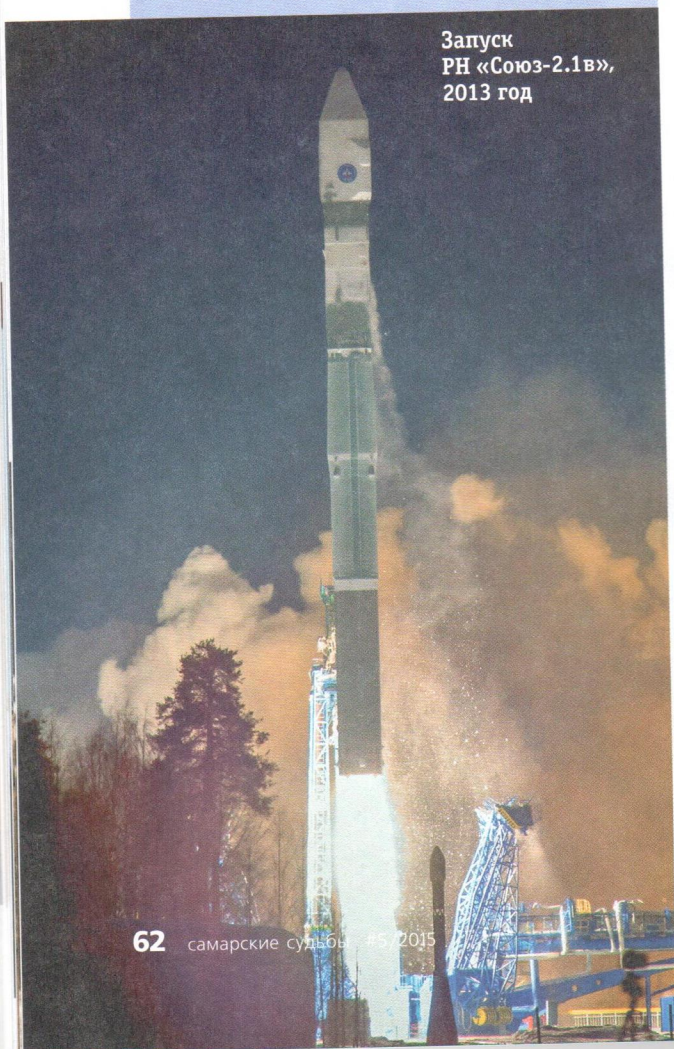
Запуск РН «Союз-2.1в», 2013 год

Самарский ракетно-космический центр – это не только известные во всем мире ракеты. С 60-х годов XX века предприятие разрабатывает и изготавливает спутники различного назначения. За годы работы в этой области было выпущено 28 типов космических аппаратов. Одно из приоритетных направлений – создание космических аппаратов дистанционного зондирования Земли (ДЗЗ). Данные дистанционного зондирования Земли необходимы для решения различных задач – от мониторинга чрезвычайных ситуаций до поиска полезных ископаемых и картографирования территорий. В настоящее время на орбите работают три самарских космических аппарата ДЗЗ: «Ресурс-ДК», «Ресурс-П» № 1 и «Ресурс-П» № 2. «Ресурс-ДК» был запущен в 2006 году, за время работы спутником отснято более 83 млн. кв.км. Важное отличие спутников «Ресурс-П» № 1 (2013 г.) и № 2