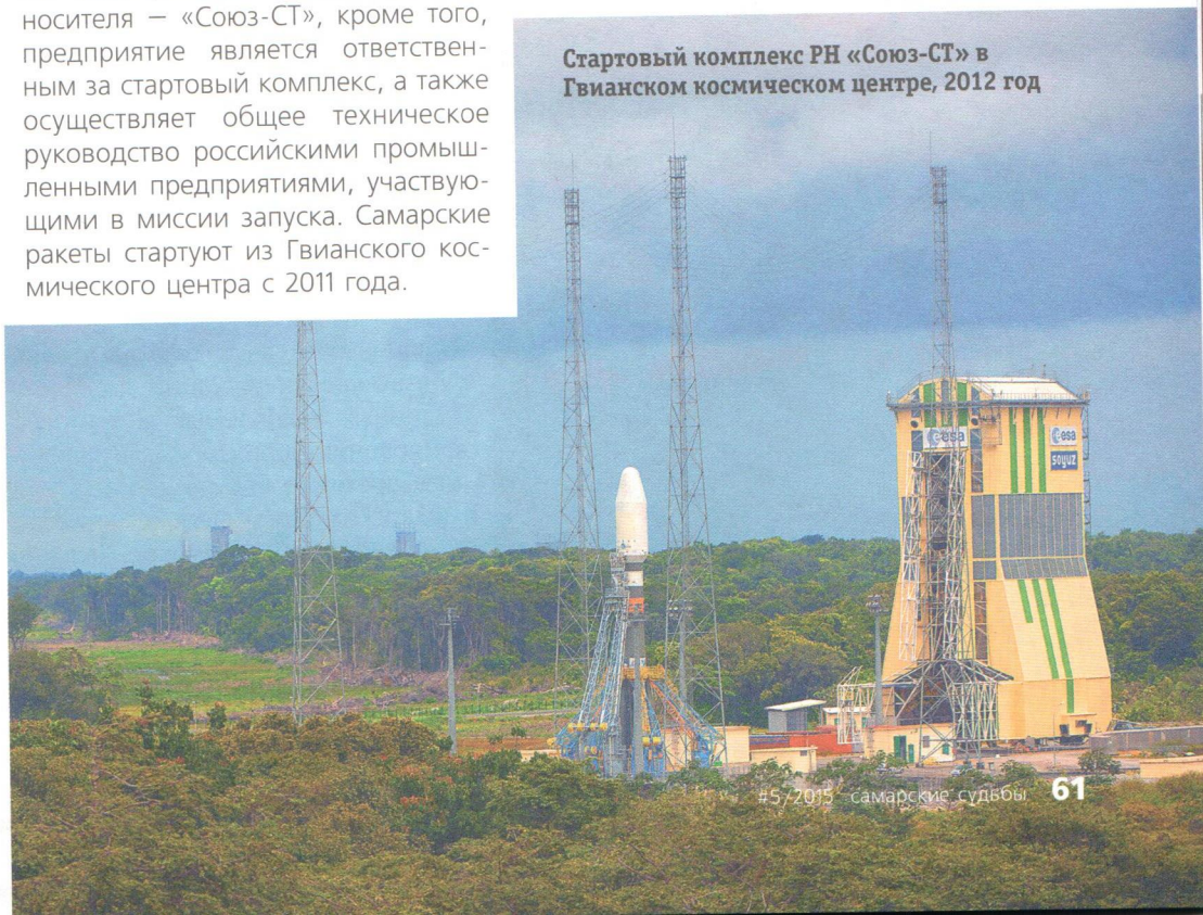
Стартовый комплекс РН «Союз-СТ» в Гвианском космическом центре, 2012 год