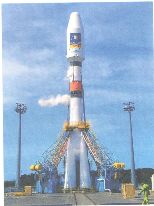
Запуск РН «Союз-СТ» из Гвианского космического центра, 2012 год

Высокие технические характеристики ракет-носителей открыли самарскому ракетно-космическому центру мировой космический рынок. Предприятию принадлежит ключевая роль в масштабном международном проекте «Союз» в Гвианском космическом центре. Для запусков из Южной Америки специалистами «Прогресса» была разработана модификация новой ракеты-носителя — «Союз-СТ», кроме того, предприятие является ответственным за стартовый комплекс, а также осуществляет общее техническое руководство российскими промышленными предприятиями, участвующими в миссии запуска. Самарские ракеты стартуют из Гвианского космического центра с 2011 года.