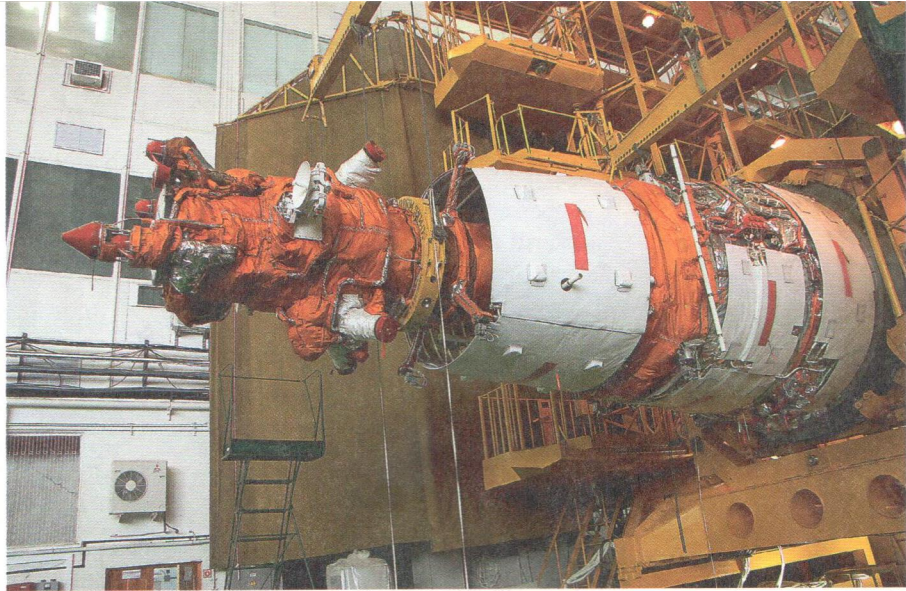
Космический аппарат «Ресурс-П» № 1, 2013 год

(2014 г.) от большинства КА ДЗЗ - возможность комплексного наблюдения поверхности Земли. У них на борту установлено несколько видов оптико-электронной аппаратуры. Данные космической съемки, получаемые со спутников, используют 18 различных российских ведомств. В дальнейшем планируется пополнить группировку космических аппаратов «Ресурс-П» еще тремя спутниками.